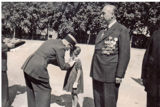
PLACE THIERS, CAHORS, 1949